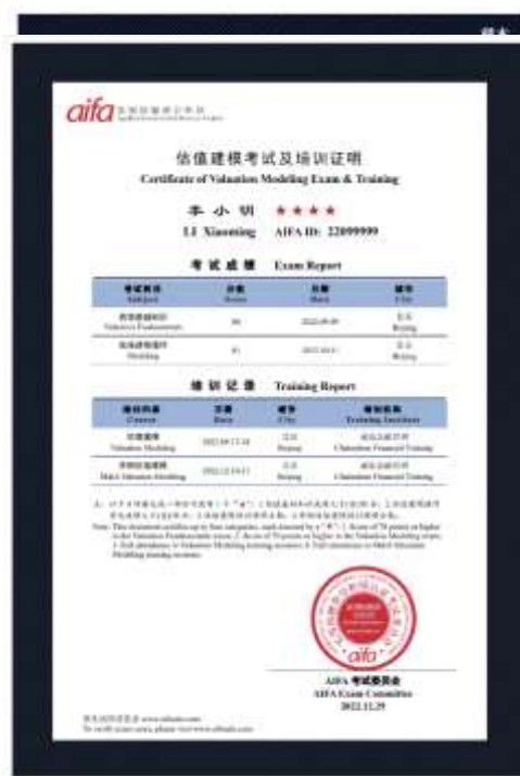
估值建模考试及培训证明